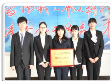
2013 年第七届“用友杯” 全国大学生会计信息化技能大赛