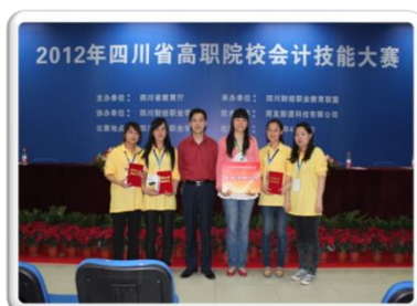
2012 年四川省高职院校 会计技能大赛