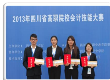
2013 年四川省高职院校 会计技能大赛